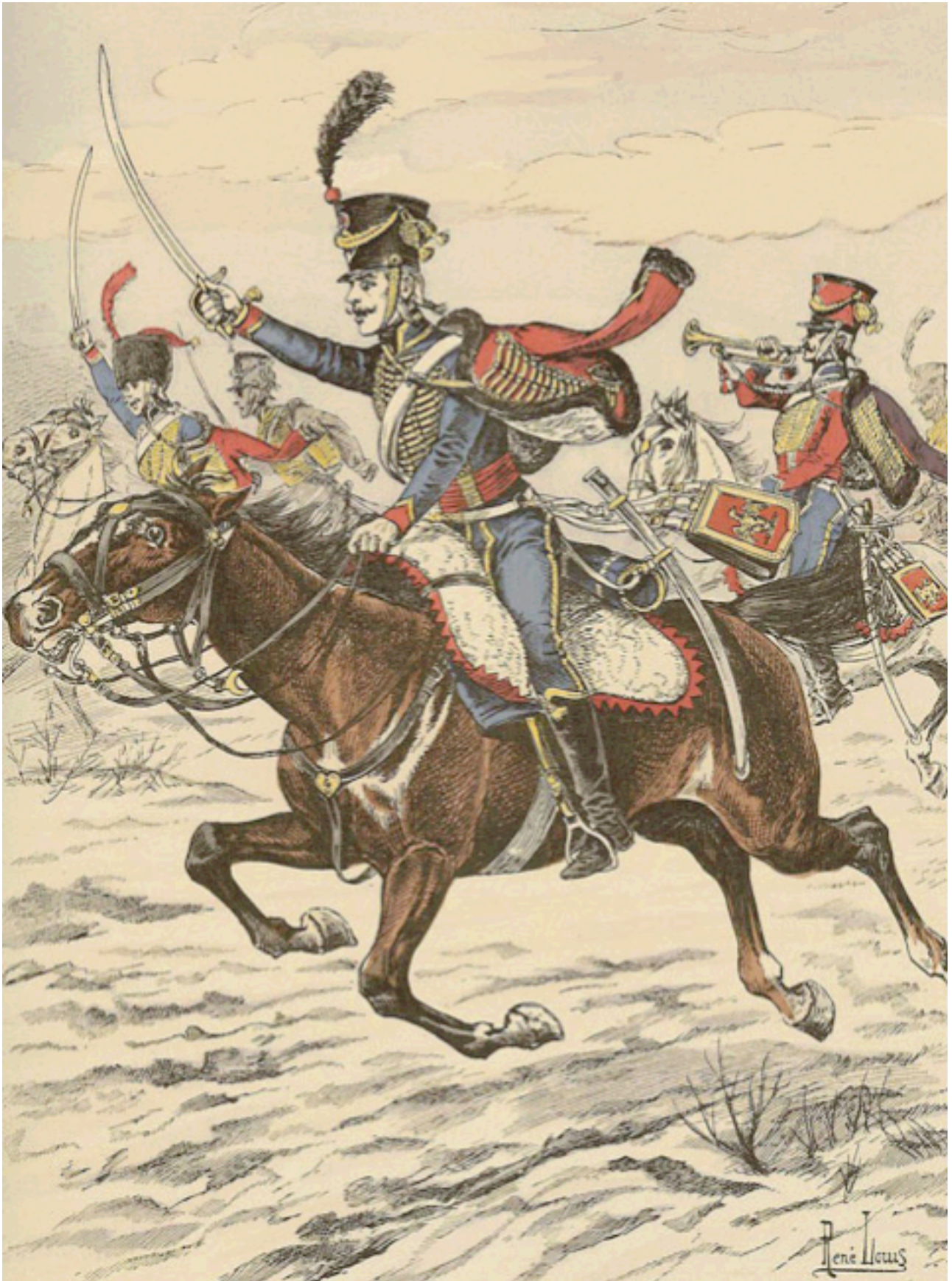
Le 4e de Hussards à Austerlitz, le 2 décembre 1805.