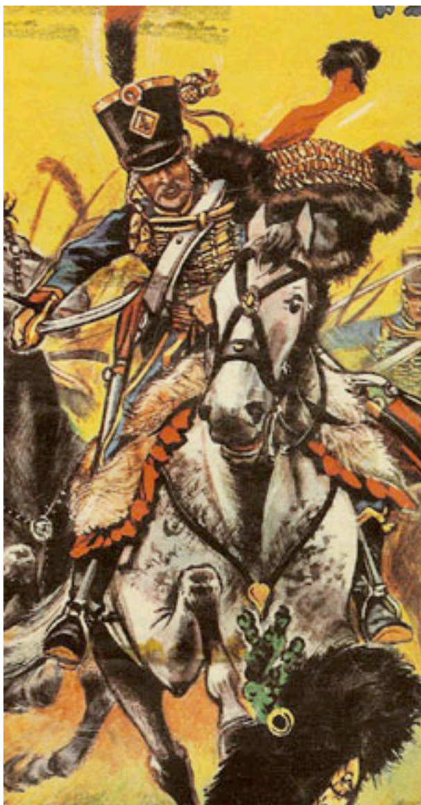
Soldat du 4e de Hussards (Dimpre).

- "Soldats des guerres napoléoniennes" n° 7, "Les Hussards de Napoléon" (2002), tiré de l'Osprey correspondant, donne page 5 un trompette du 4e en 1804-1805 et page 9 un trompette-major en Espagne vers 1810.