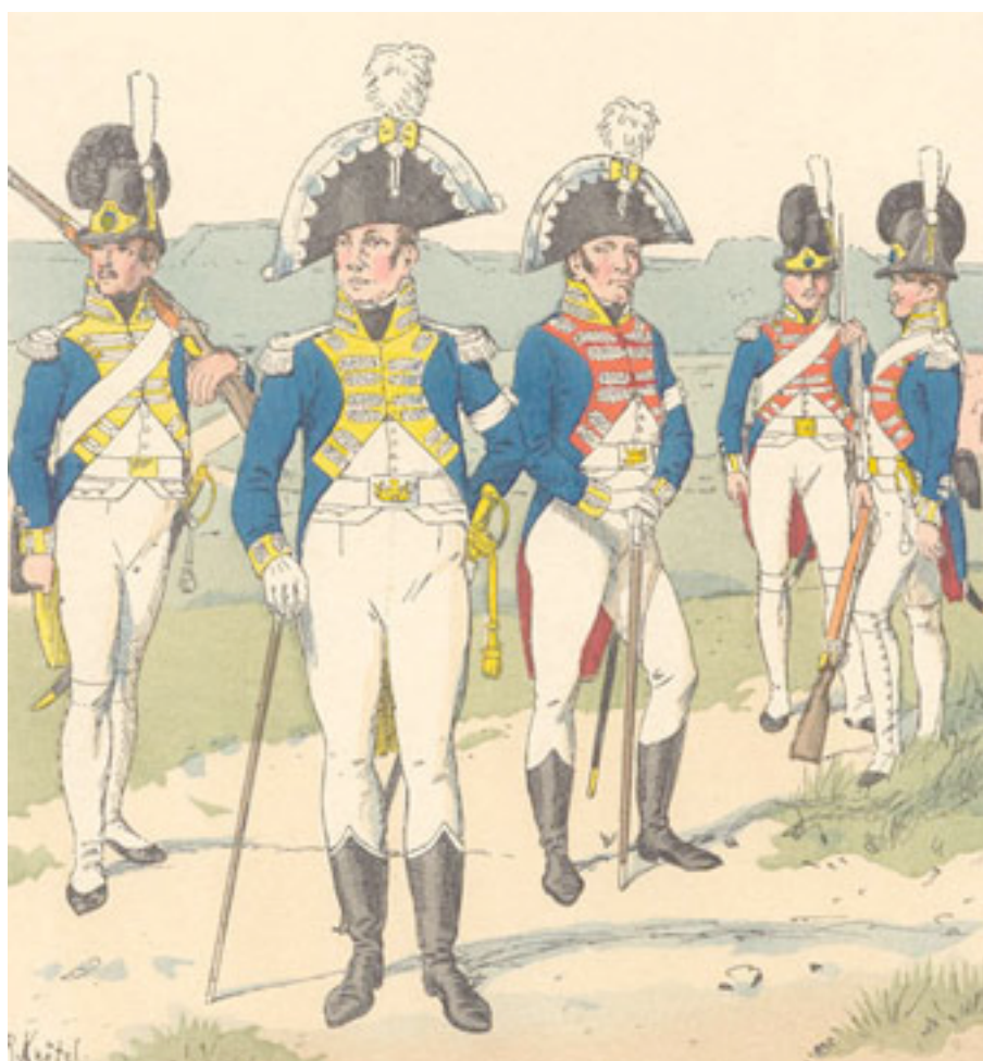
Officiers et soldats des Konungens Svea Lif Garde et Andra Lif Garde en 1807.

Sources: Aminoff, Sveriges Krig , vol. 1