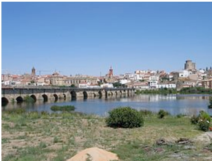
Vue de Alba de Tormes depuis "le bon côté" de la rivière, celui des "spectateurs"

Pas de carré abordé dans la partie tactique de l'école du bataillon. Le carré creux ne se conçoit qu'au niveau de la brigade, comme déjà dit. Du coup les occurrences d'en former se réduisent en rapport. De mémoire j'en connais deux, Alba de Tormes en 1809 et La Gevora en 1811.