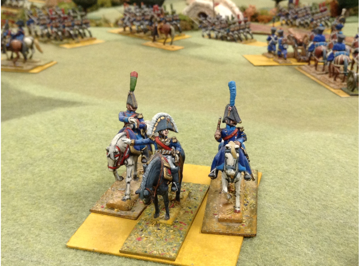
Figurines Minifigs 25 mm transformées et peintes par Claude Daviet (collection J.-A. Mané).

Le général Vandamme au commencement de la partie. Après l'intervention des Autrichiens sur son flanc gauche il vient d'apprendre l'irruption des Prussiens dans le dos de ses troupes.