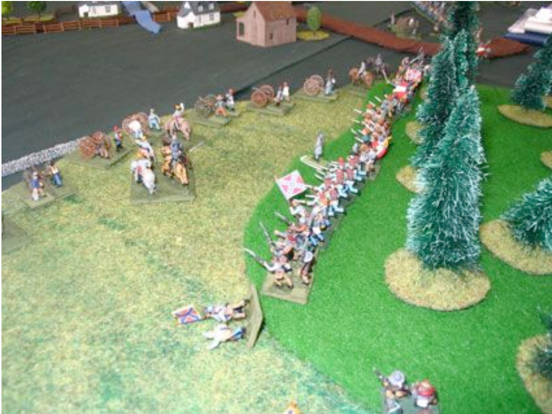
La charge de Pickett à Gettysburg. Piquette en vue !