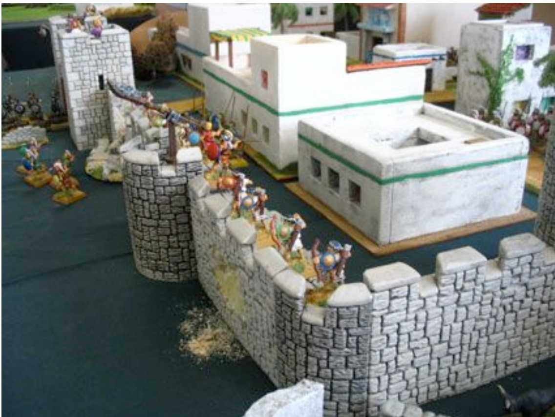
La guerre de trois (ou quatre) aura bien lieu.