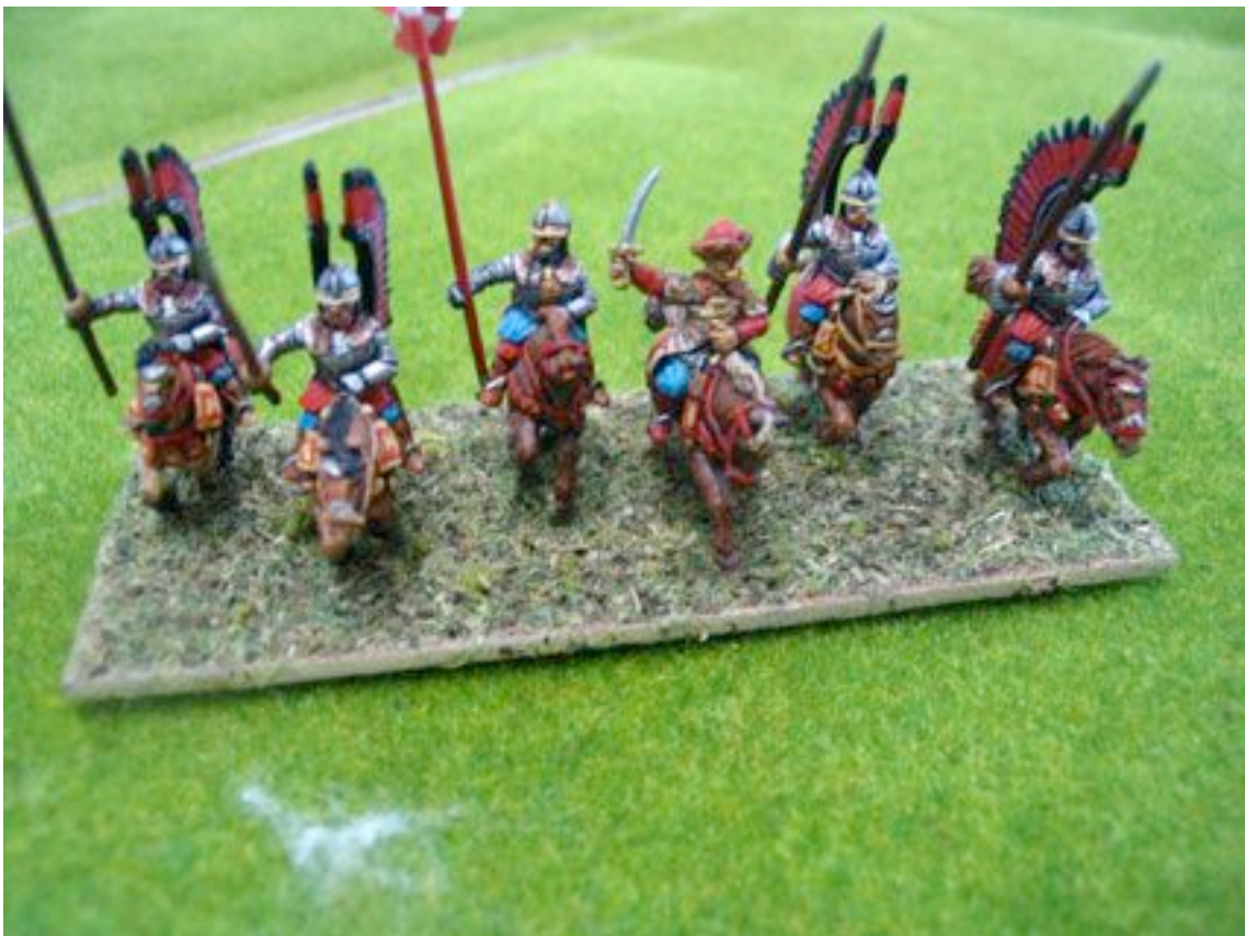
Les hussards zélés de Sobieski... et leur truc en plumes !