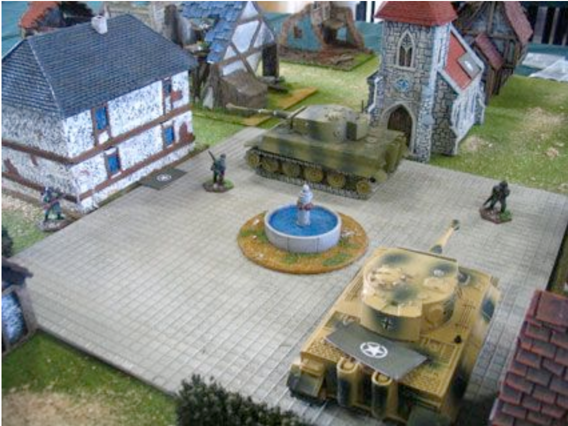
De l'or pour les braves. Notre homme Clint n'est pas loin !