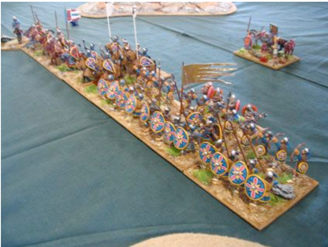
C'est encore Byzance, et c'est toujours beau !