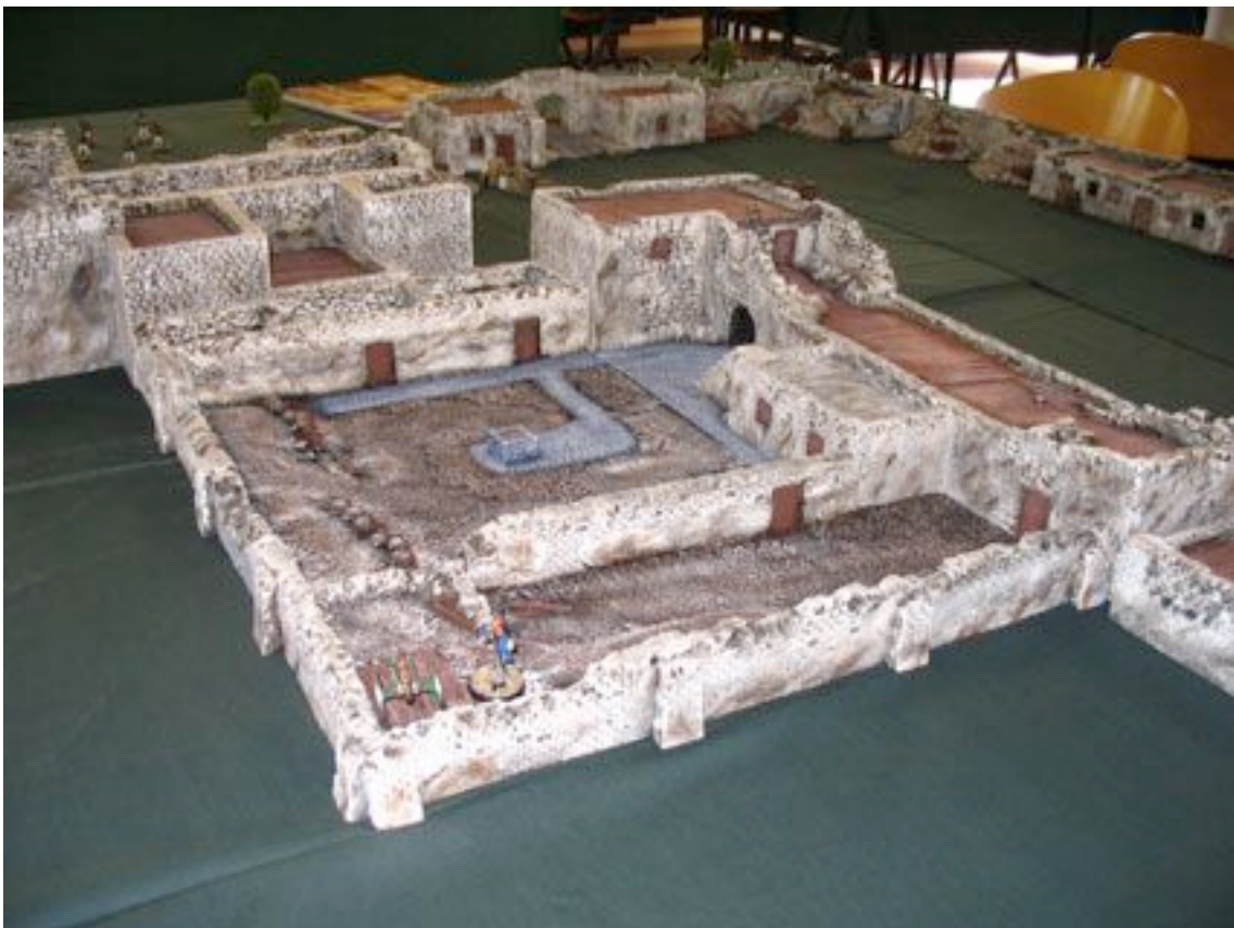
Alamo, Alamo, morne plaine... mais joli travail !