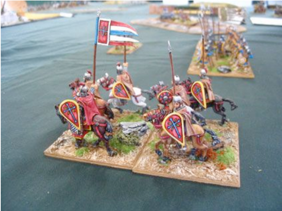
C'est Byzance, et c'est beau !