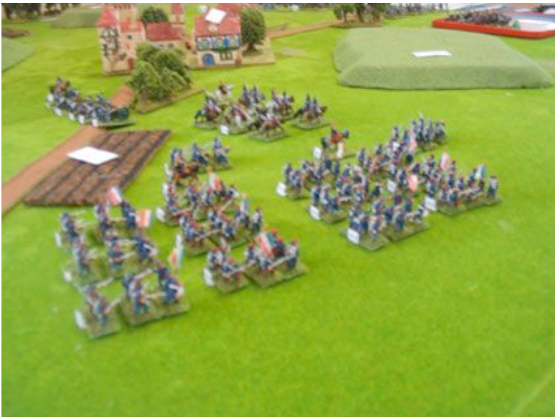
Italie 1859. Se battre dans une herbe si verte, un plaisir !