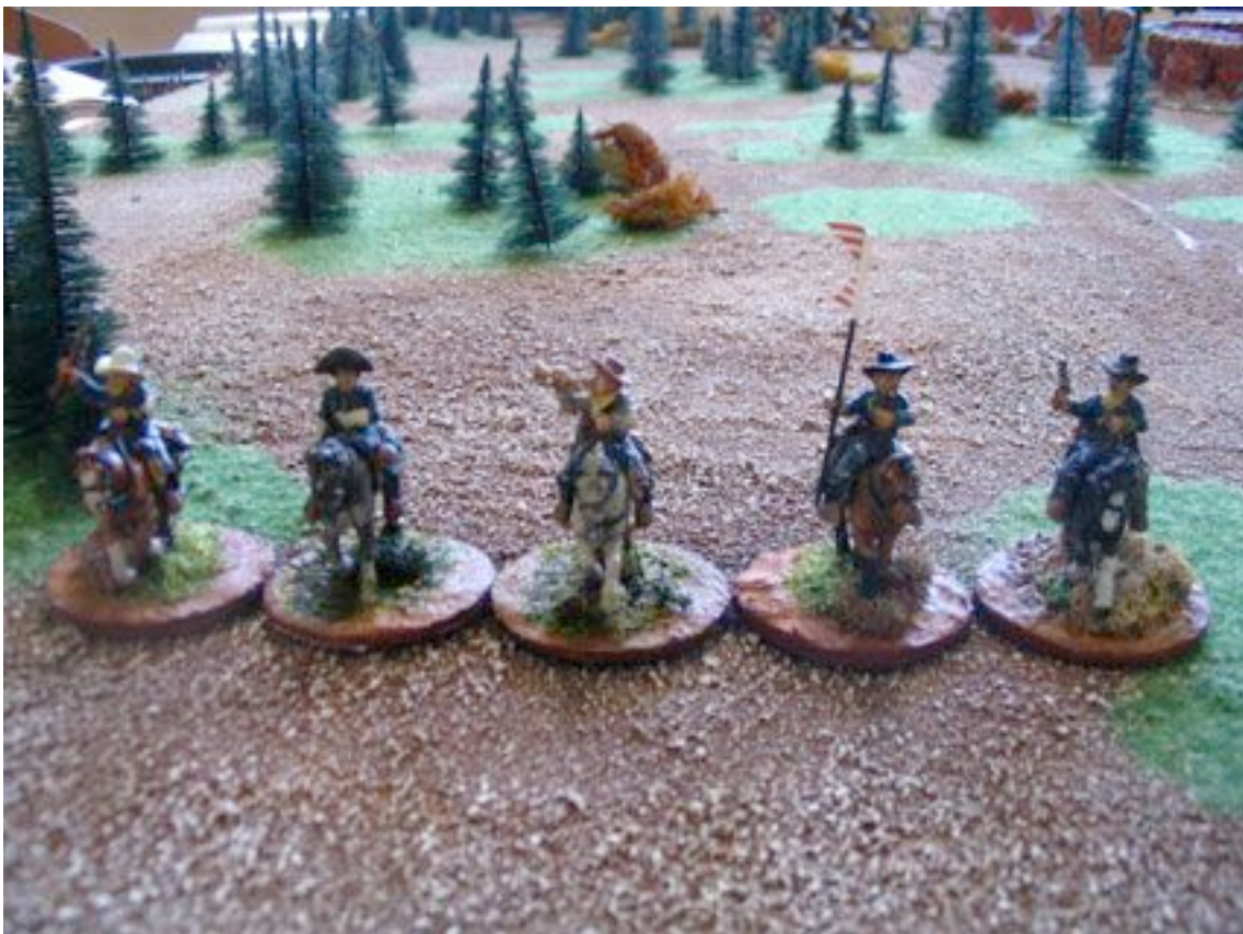
Les héros du 7e de Cavalerie dans leurs oeuvres (charitables ?).