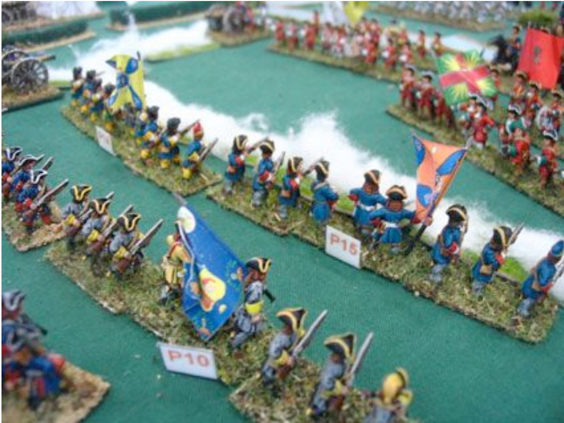
La guerre en dentelles, telle qu'on s'y croirait !