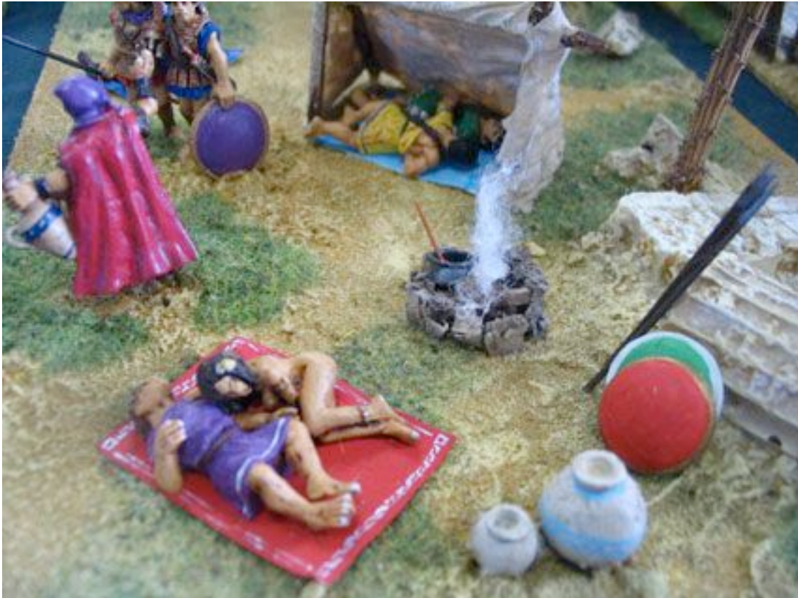
Tués en pleine orgie. Quelle belle mort !