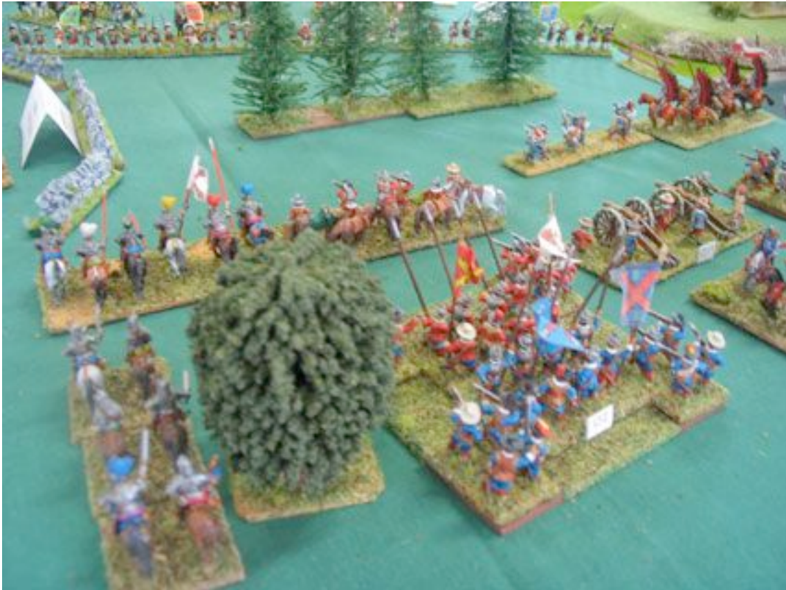
Canons et arquebuses. La guerre devient impossible !