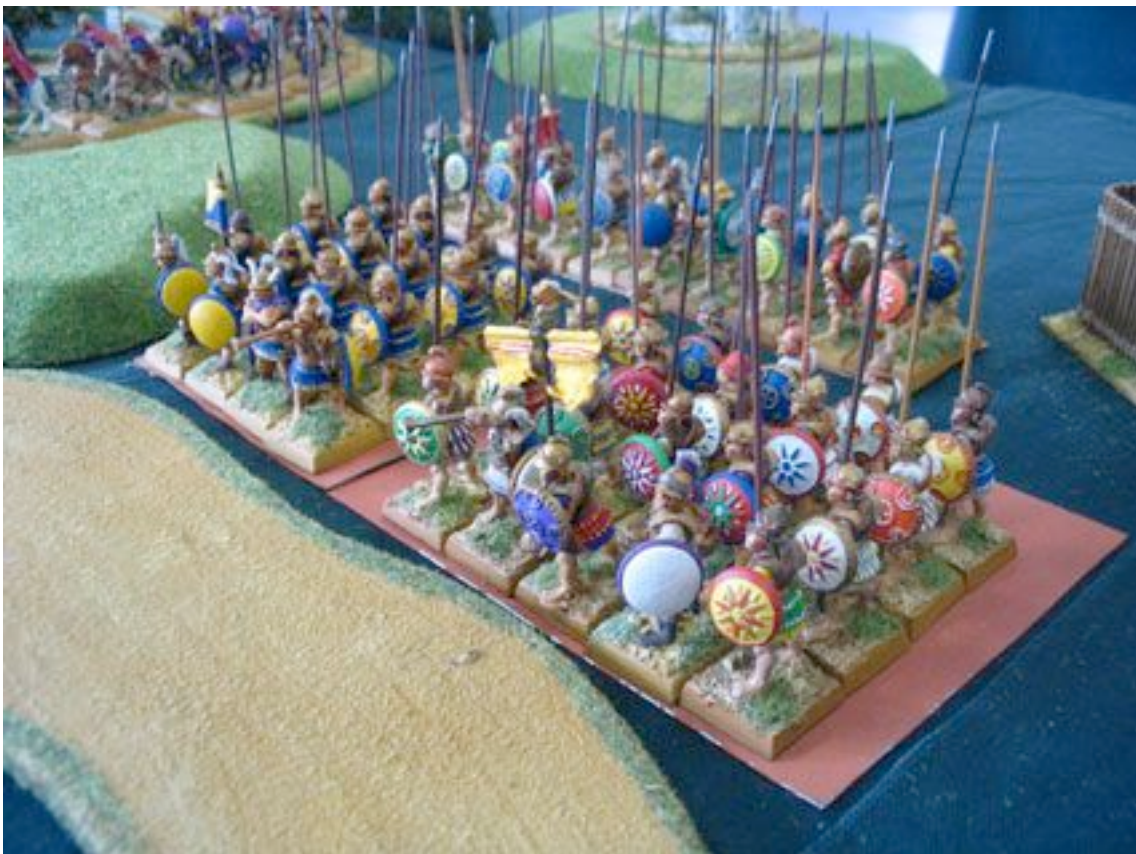
La phalange. Qui s'y frotte six piques !